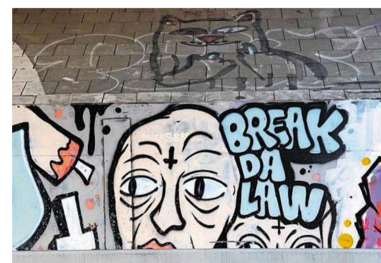
De provincie verwijdert alleen aanstootgevende tekeningen en teksten.

„ Ze willen op zoveel mogelijk plekken hun plasje achterlaten