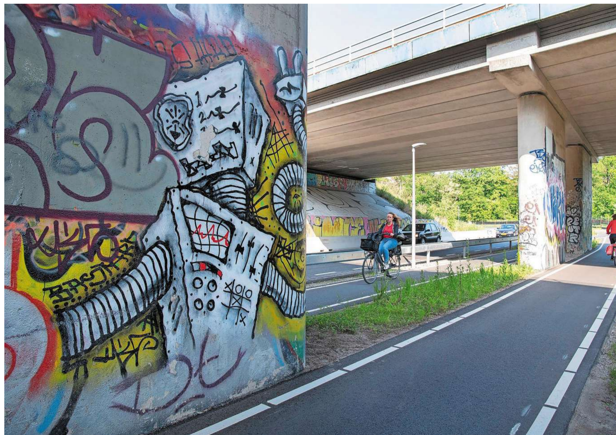
De nieuwe weg tussen Baarn en Hilversum fleurt op door alle graffiti.